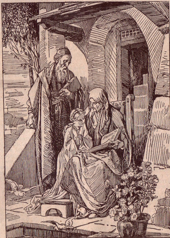
ŚW. ANNA I JOACHIM RODZICÉ NAJSW. MARJI PANNY.